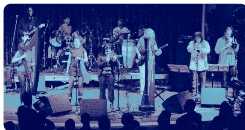
Concert sous le parrainage du CLUB 41 FRANÇAIS avec le soutien du CRÉDIT AGRICOLE NORD-DE-FRANCE

A nous les mélodies dansantes, le rythme chaloupé et... le chaud soleil de la Martinique !