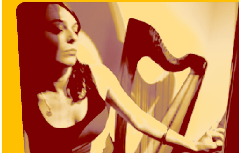
Une organisation des villes de Feignies et Maubeuge, du Manège/Maubeuge/Mons et de Harpe en Avesnois

VENDREDI 9 FÉVRIER 2007 • 20H30 ESPACE GÉRARD PHILIPPE • FEIGNIES