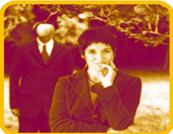
Soirée sous le parrainage du Club 41 français avec le soutien du Crédit Agricole Nord-de-France

La critique a salué la sortie de son premier disque en 2004 : « Harpiste virtuose, mais nullement harpie, elle se joue des mots et des modes grâce à une voix chaude et sensuelle. Et toute bretonne qu'elle soit, dédie l'une de ses plus belles chansons à Paris. Hors piste, cette harpiste. » (Philippe Barbot, Télérama N°2873)